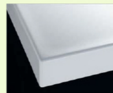
H プレーンホワイト