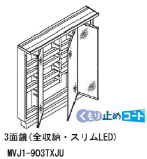
3面鏡(全収納・スリムLED) MVJ1-903TXJU