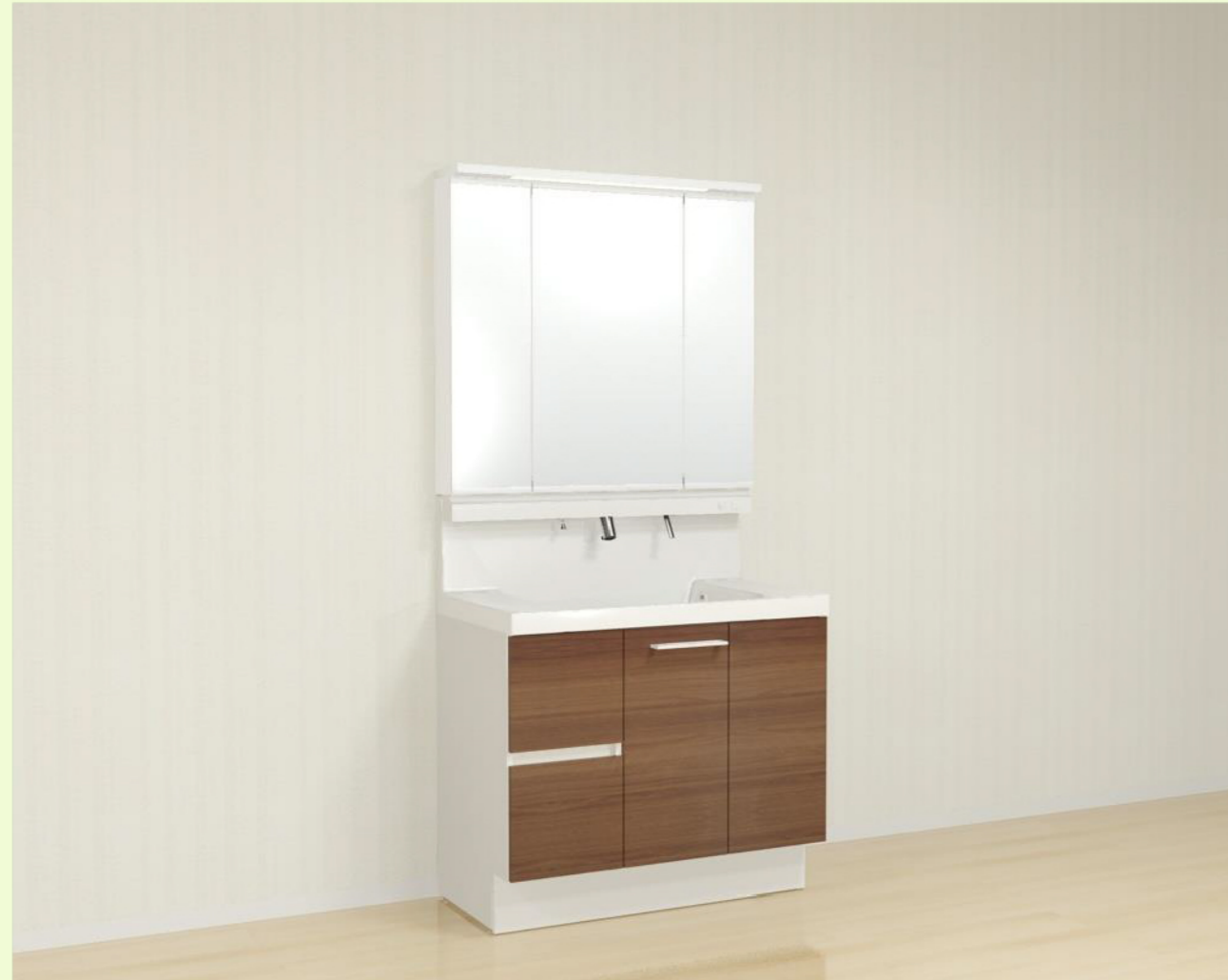
CG合成によるイメージ画像です。