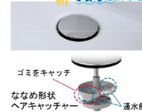
ゴミをキャッチ ななめ形状ヘアキャッチャー 通水部