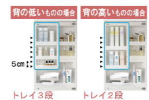
トレイ3段 トレイ2段